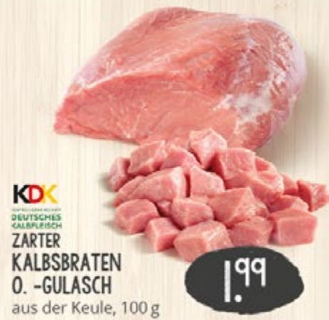
KOK DEUTSCHES KALBSFLEISCH ZARTER KALBSBRATEN O.-GULASCH aus der Keule, 100 g