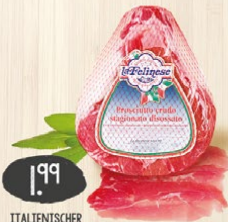
1,99 ITALIENISCHER LANDSCHINKEN luftgetrockneter, milder Schinken, 100 g