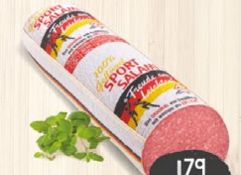
SPORT SALAMI LIGHT milde Salami mit weniger als 25% Fett, 100 g