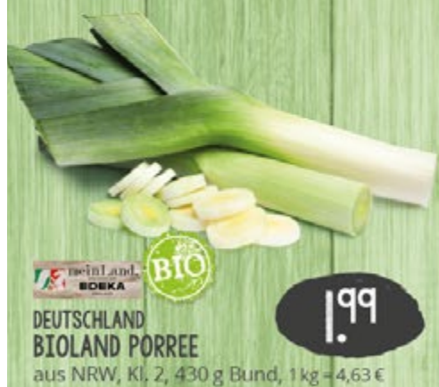
1.99 UNVER- PACKT DEUTSCHLAND BIOLAND PORREE aus NRW, Kl. 2, 430 g Bund, 1 kg = 4,63 €