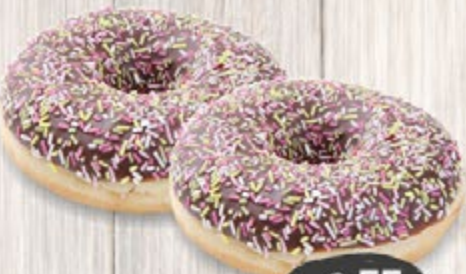
BUNTER DONUT ein süßes Hefengebäckstück überzogen mit Vollmilchschokolade und bunten Streuseln, je Stück