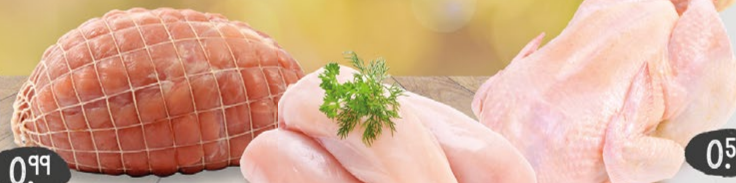
FRISCHES PUTENROLLBRATEN Hkl. A, aus der saftigen Oberkeule, 100 g