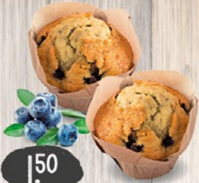
BLAUBEER-MUFFINS ein besonders lockerer Hefeteig mit saftigen Blaubeeren, je Stück