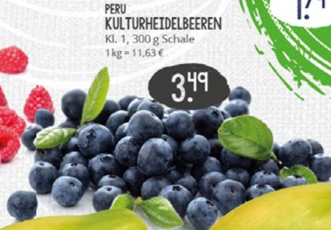
3.49 UNVER- PACKT PERU KULTURHEIDELBEEREN Kl. 1, 300 g Schale 1 kg = 11,63 €