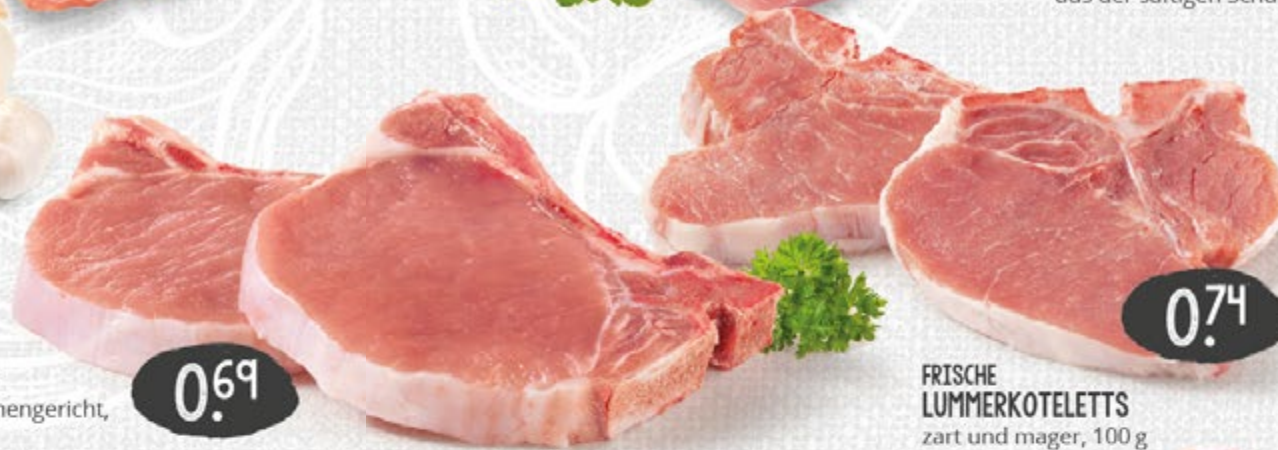
FRISCHE LUMMERKOTELETTS zart und mager, 100 g