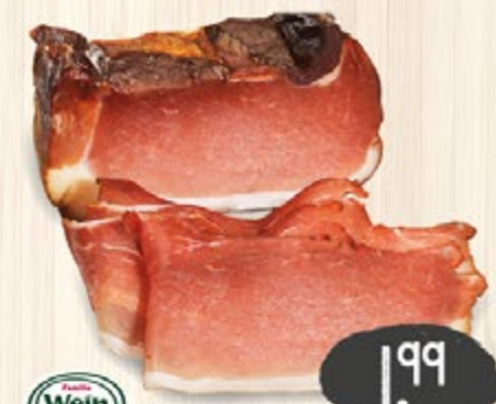
1,99 Wein SCHWARZWÄLDER SCHINKEN über Tannenholz geräuchert, kräftig im Geschmack, 100 g