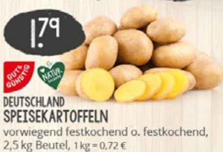
1.79 UNVER- PACKT DEUTSCHLAND SPEISEKARTOFFELN vorwiegend festkochend o. festkochend, 2,5 kg Beutel, 1 kg = 0,72 €