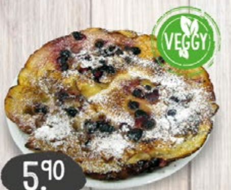
BLAUBEER-PFANNKUCHEN mit frischen Blaubeeren, je Stück