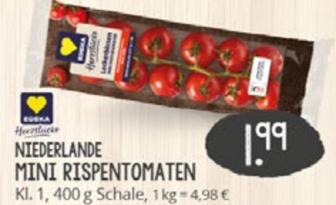
1.99 UNVER- PACKT NIEDERLANDE MINI RISPE TOMATEN Kl. 1, 400 g Schale, 1 kg = 4,98 €