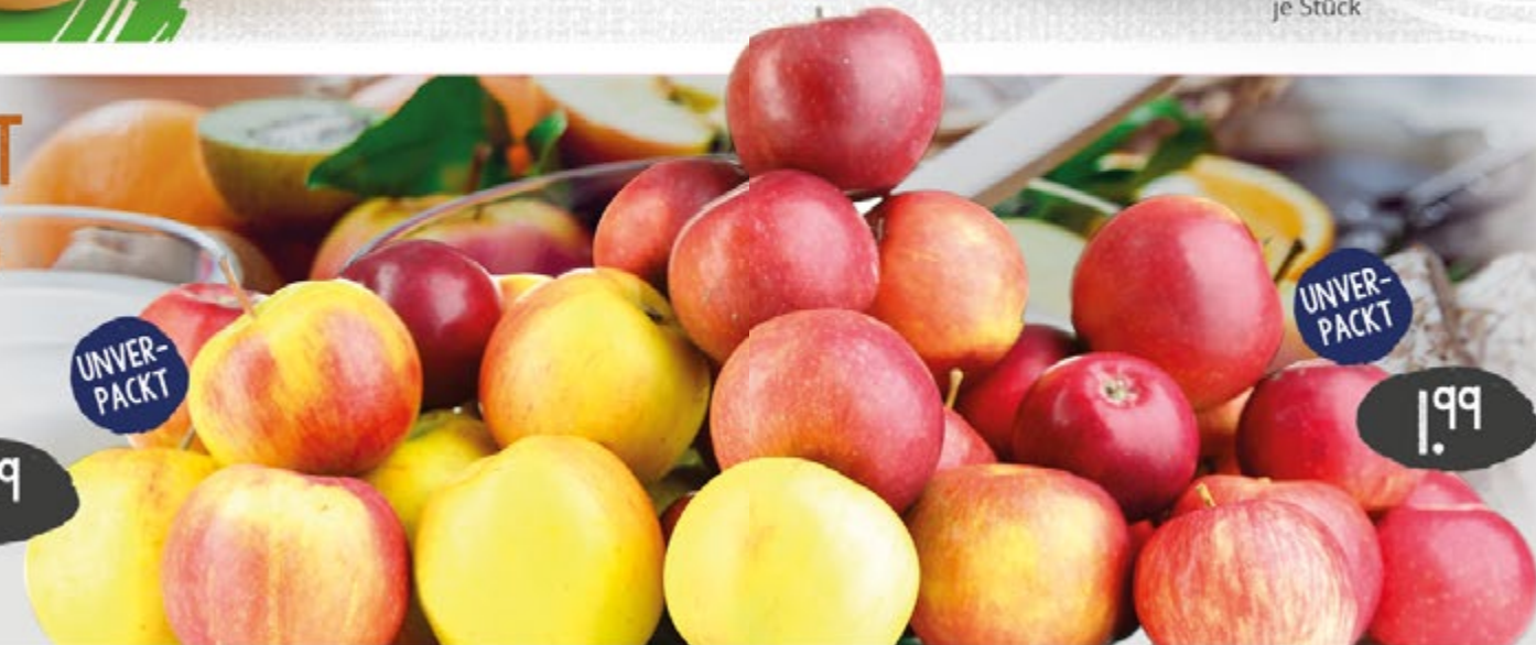
1.99 UNVER- PACKT DEUTSCHLAND TAFELÄPFEL „Boskoop“, „Boskoop“, „Holsteiner Cox“, „Junami“ o. NEUSEELAND TAFELÄPFEL „Cripps Pink“ o. FRANKREICH TAFELÄPFEL „Honeycrisp“, Kl. 1, 1 kg