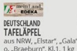
1.99 UNVER- PACKT DEUTSCHLAND TAFELÄPFEL aus NRW, „Elstar“, „Gala“ o. „Braeburn“, Kl. 1, 1 kg