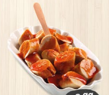
CURRYWURST feine Grillwurst in einer pikanten Sauce, 100 g