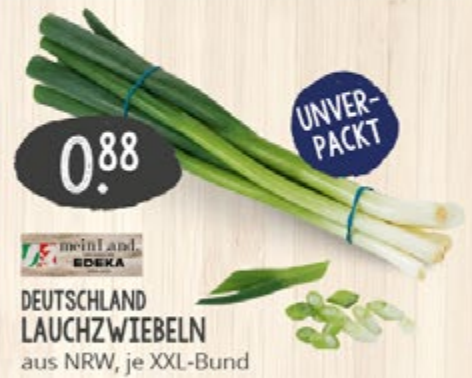
0.88 UNVER- PACKT DEUTSCHLAND LAUCHZWIEBELN aus NRW, je XXL-Bund