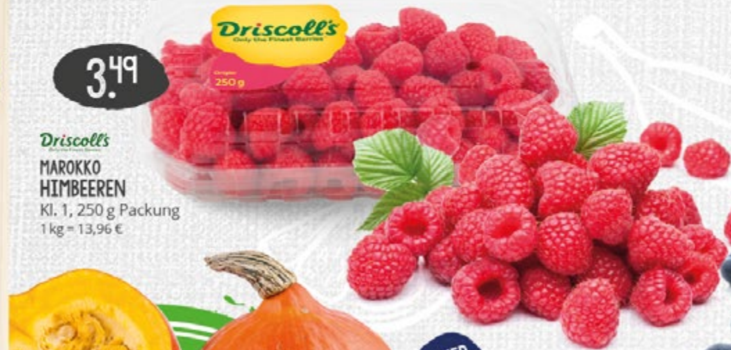
3.49 UNVER- PACKT Driscoll's MAROKKO HIMBEEREN Kl. 1, 250 g Packung 1 kg = 13,96 €