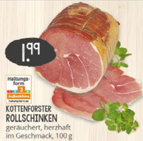
1,99 Haltungsform 3 Außenklima KOTTENFORSTER ROLLSCHINKEN geräuchert, herzhaft im Geschmack, 100 g