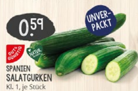
0.59 UNVER- PACKT SPANIEN SALATGURKEN Kl. 1, je Stück