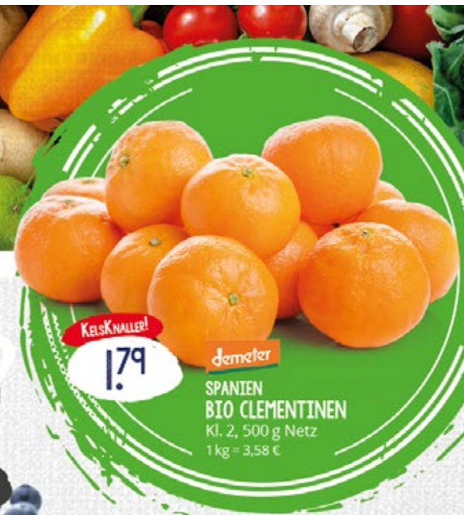
1.79 UNVER- PACKT KELSKNALLER! demeter SPANIEN BIO CLEMENTINEN Kl. 2, 500 g Netz 1 kg = 3,58 €