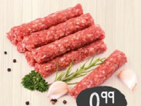
CEVAPCICI aus Rind- und Schweinefleisch, mit feiner Paprika-Knoblauch-Note abgerundet, 100 g