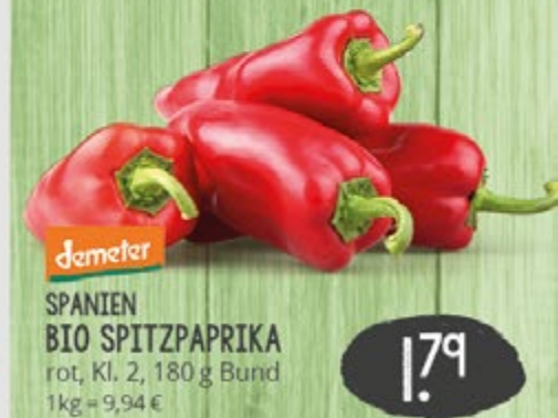
1.79 UNVER- PACKT SPANIEN BIO SPITZPAPRIKA rot, Kl. 2, 180 g Bund 1 kg = 9,94 €