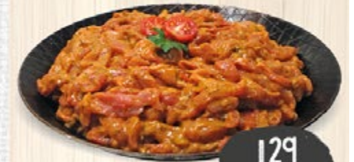
GEFLÜGELPFANNE „ADRIA“ mit Paprika und Zucchini, küchenfertig vorbereitet, 100 g