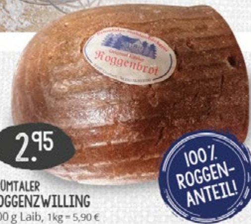
PRÜMTALER ROGGENZWILLING 500 g Laib, 1kg = 5,90 €

NICHT IN RATINGEN- HÖSEL/LINTORF ERHÄLTLICH!