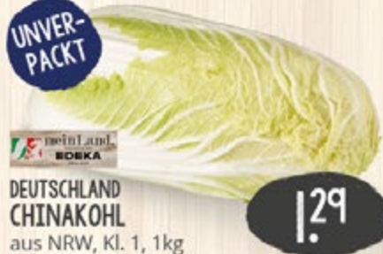
1.29 UNVER- PACKT DEUTSCHLAND CHINAKOHL aus NRW, Kl. 1, 1kg