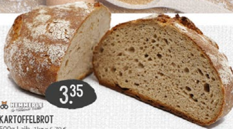
KARTOFFELBROT 500g Laib, 1kg = 6,70 €