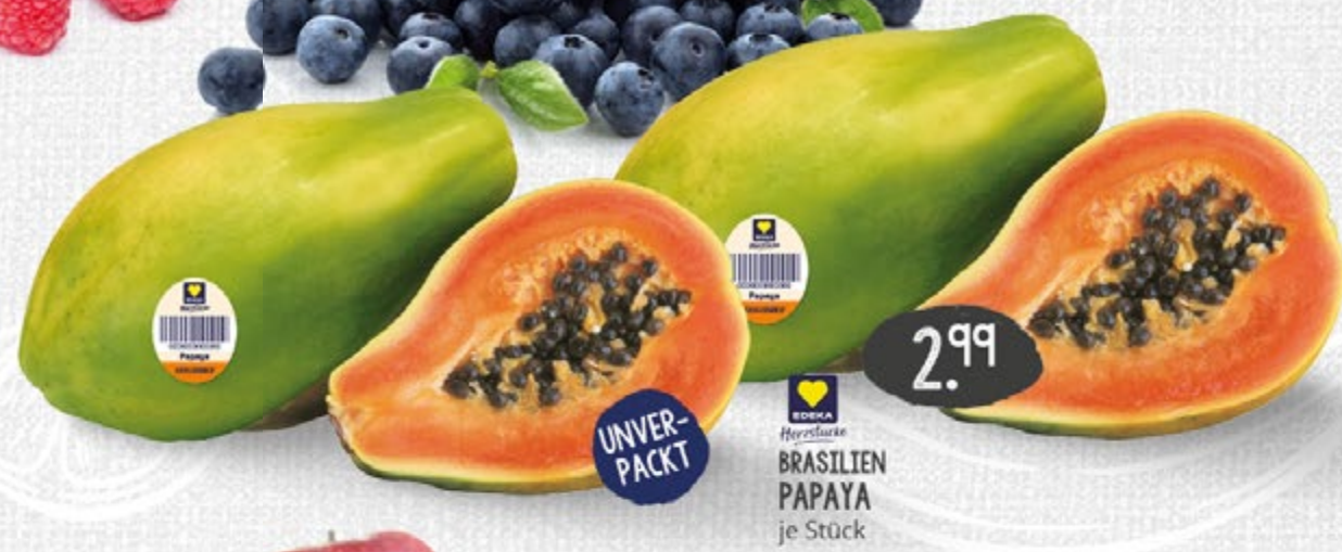
2.99 UNVER- PACKT BRASILIAN PAPAYA je Stück