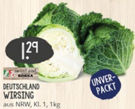
1.29 UNVER- PACKT DEUTSCHLAND WIRSING aus NRW, Kl. 1, 1kg