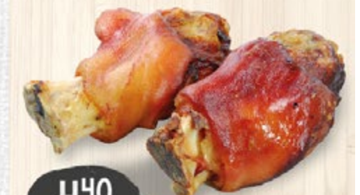
FRISCH GEGRILLTE SCHWEINSHAXE je Stück