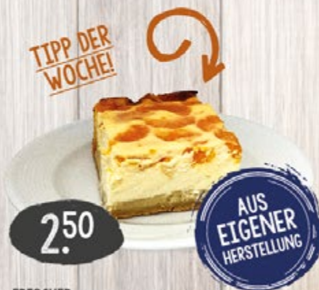
FRISCHER MANDARINEN-KÄSEKUCHEN je Stück