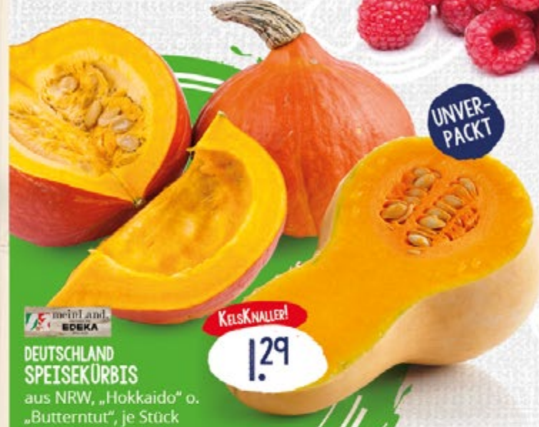
1.29 UNVER- PACKT DEUTSCHLAND SPEISEKÜRBIS aus NRW, „Hokkaido“ o. „Buttertut“, je Stück