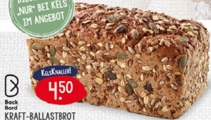
KRAFT-BALLASTBROT mit geraspelten Möhren, 750 g Laib 1kg = 6,00 €