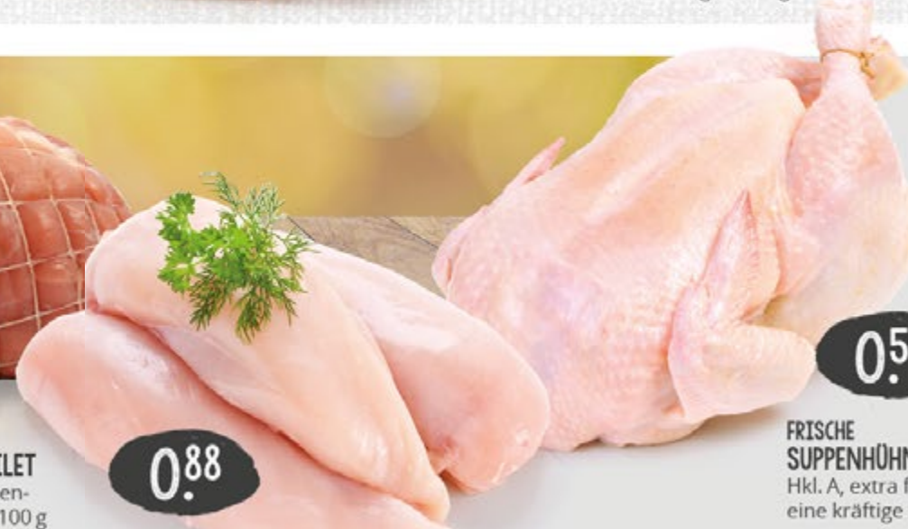
FRISCHE SUPPENHÜHNER Hkl. A, extra fleischig, für eine kräftige Suppe, 100 g