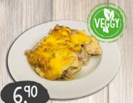
KARTOFFEL- PAPRIKA-AUFLAUF CLMG pro Portion

DEFTIGE LECKEREIEN AB 15 UHR! ...IN MÜLHEIM, ESSEN, RATINGEN (TRINKGUT) & WALLHÖFE