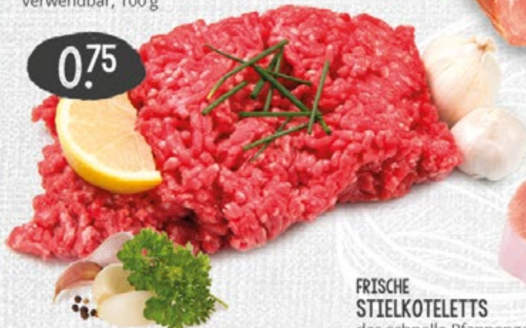
FRISCHE STIELKOTELETTS das schnelle Pfannengericht, 100 g