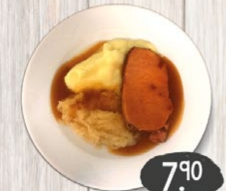
KASSLER CLMG mit Kartoffelpüree & Sauerkraut, pro Portion