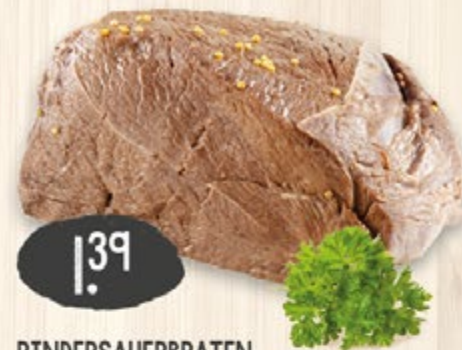
RINDERSAUERBRATEN nach Hausfrauenart ingelegt, 100 g