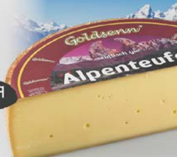
GOLDSENN ALPENTEUFEL traditionell aus frischer Bergbauern- röhmilch aus dem Toggenburger Tal, mind. 180 Tage gereift, cremig würzig, 56 % Fett i. Tr., 100 g