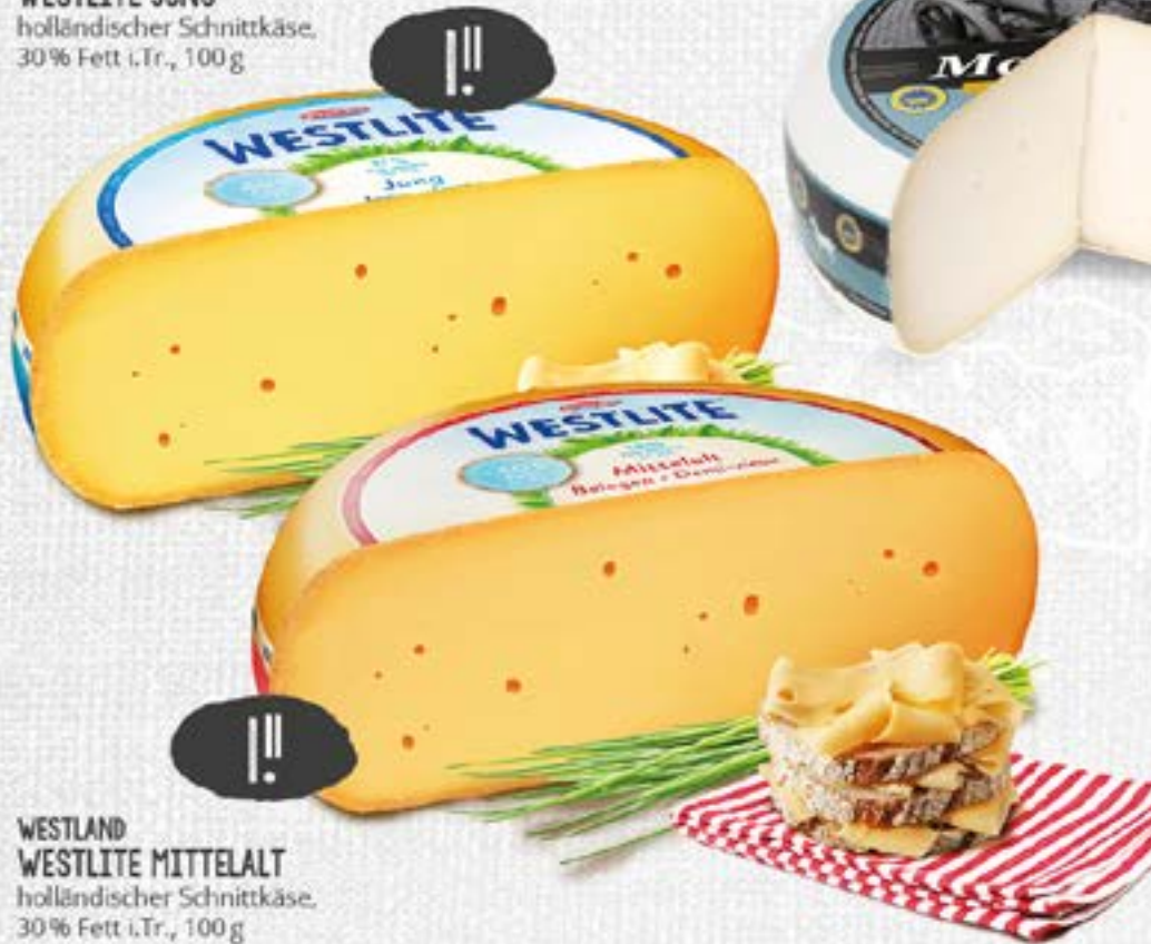
WESTLAND WESTLITE MITTELALT holländischer Schnittkäse, 30% Fett i. Tr., 100 g